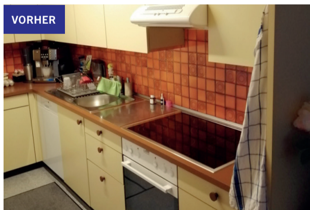
Altbau-Liegenschaft vor der Sanierung.

Generalica hat seit 2000 mehrere Umbau- und Sanierungsprojekte von der Planung bis zur Fertigstellung begleitet und über 500 Immobilien erfolgreich am Markt positioniert.